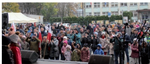
Na Piknik Patriotyczny przybyło wielu mieszkańców.