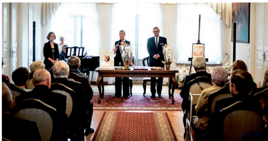
Uroczystość odbyła się w Austerii.