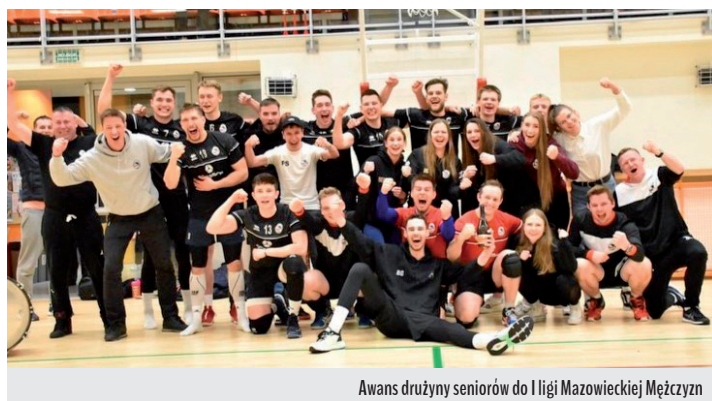
Awans drużyny seniorów do I ligi Mazowieckiej Mężczyzn