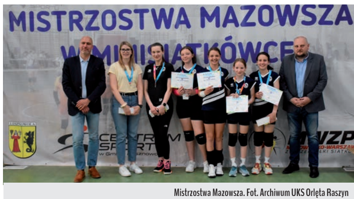
Mistrzostwa Mazowsza.