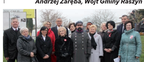
Samorządowcy z Marszałkiem Piłsudskim.