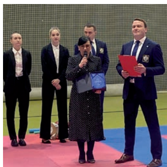
IKA POLAND turniej.