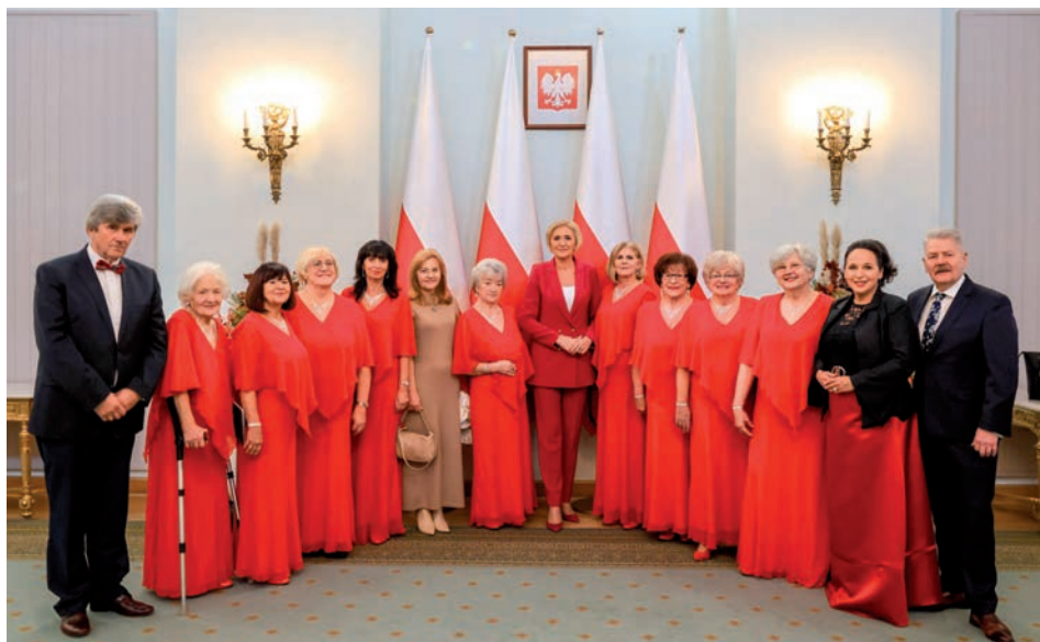
Gala w Pałacu Prezydenckim.

7 listopada w Pałacu Prezydenckim odbyła się wyjątkowa dla Centrum Kultury Raszyn uroczystość wręczenia nagród II edycji Konkursu „Razem dla Seniorów” pod Honorowym Patronatem Pierwszej Damy Agaty Kornhauser-Dudy. W jednej z trzech kategorii – „Dla Seniorów” – nasz IX Przegląd Muzyczny Zespołów Śpiewaczych Seniorów został wyróżniony spośród 300 zgłoszeń nadesłanych z całej Polski. Warto przy tym podkreślić fakt, iż kilka miesięcy wcześniej Przegląd uho-