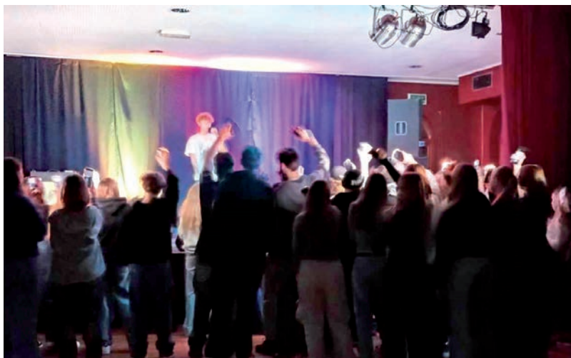
Wspólna zabawa.