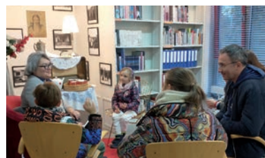
Herbatka u Jadwigi Piłsudskiej.