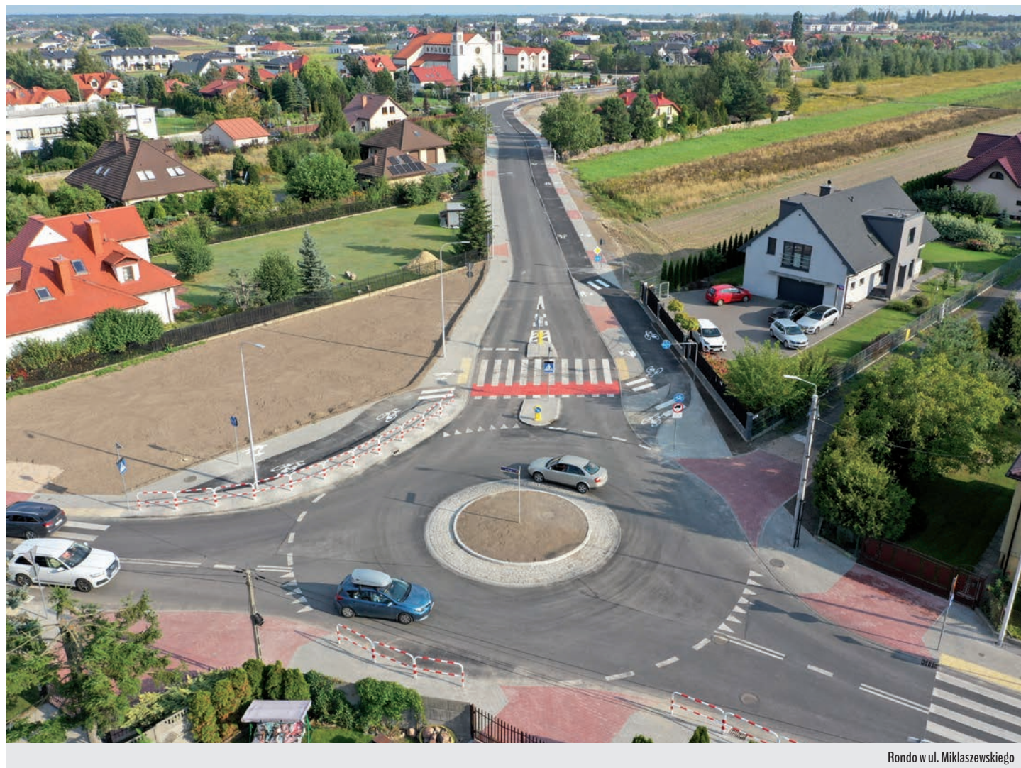
Rondo w ul. Miklaszewskiego