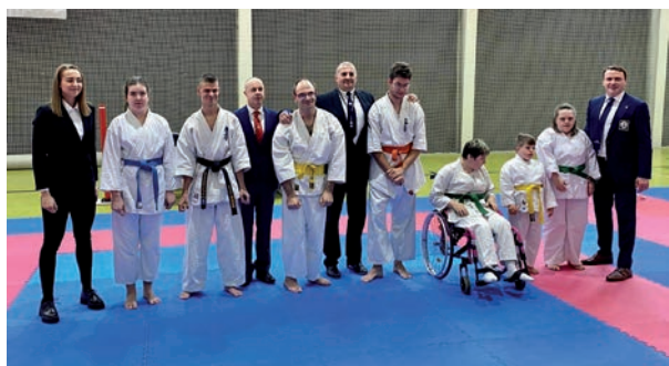
IKA POLAND turniej.

Cezary Wojciechowski Centrum Sportu Raszyn