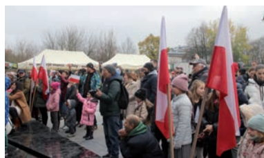
Na placu było biało-czerwono.