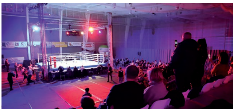
W oczekiwaniu na rozgrywkę.