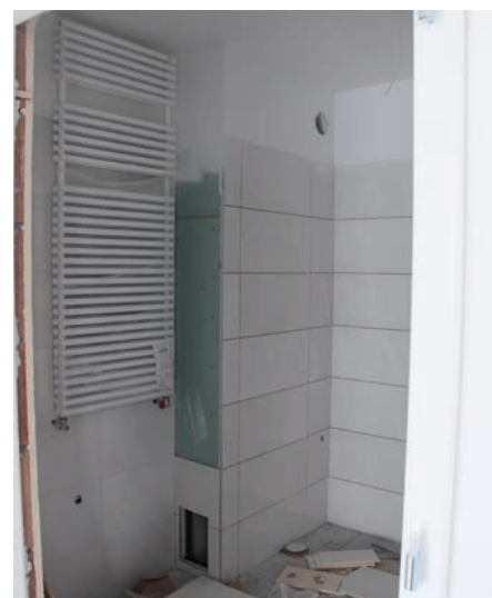
Łazienka z suszarką ręczników