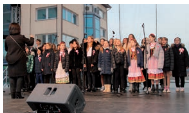
Chór z ZSP w Ładach.