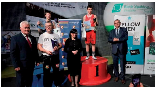
Podczas dekoracji.