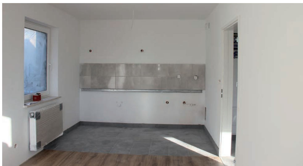
Aneks kuchenny do zabudowy