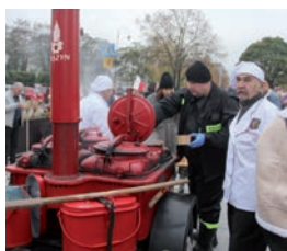
Strażacka grochówka.