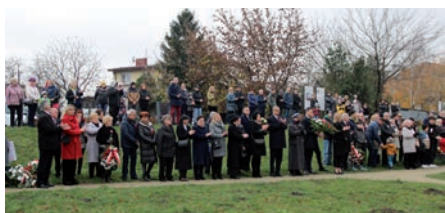
Uroczystość na Reducie Raszyńskiej.