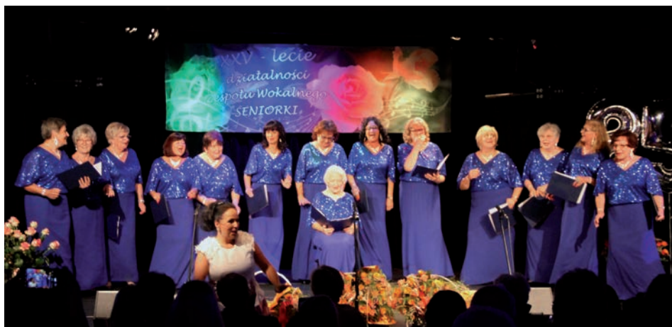
Seniorki podczas uroczystości 25. lecia.