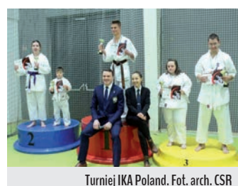
Turniej IKA Poland.