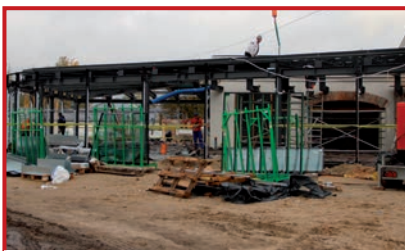
Pawilon w trakcie szklenia.

Trwająca przebudowa dawnych kramów poczty i warsztatów zostanie zakończona po oszkleniu pawilonu stanowiącego zakończenie odbudowywanego skrzydła. Wewnątrz cały czas pracują ekipy przy wykańczaniu pomieszczeń.