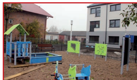
Mini plac zabaw.