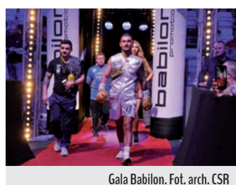
Gala Babilon.