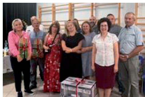
Laureaci Konkursów.