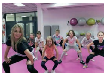
Zajęcia tańca dla dzieci.