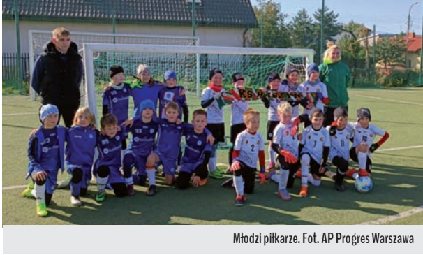
Młodzi piłkarze.

gości przejął inicjatywę. Po meczu ligowym krótka przerwa na posiłek, a następnie udaliśmy się do Powsina, aby wziąć udział w turnieju organizowanym przez AP Progres Warszawa. W turnieju wzięły udział dwa zespoły, które rozegrały po 9 spotkań! Wszyscy chłopcy pokazali się z bardzo dobrej strony, a ostatecznie nasze zespoły zajęły miejsca III oraz IV. Pogoda nas nie rozpieszczała, ale wszyscy wrócili do domu z bagażem kolejnych piłkarskich doświadczeń, uśmiechami na buziach i medalami na szyi.