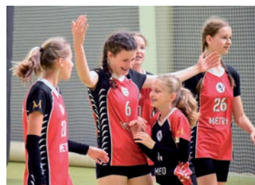
Mecz UKS Orleń.