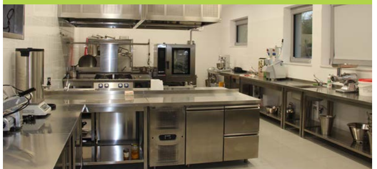
Kuchnia czysta i lśniąca

REDAKCJA KURIERA RASZYŃSKIEGO PRZEPRASZA RODZICÓW DZIECI ZE ŻŁOBKA NR 1 „BAŚNIOWA KRAINA” ZA NIEFORTUNNIE UMIESZCZONE ZDJĘCIA.