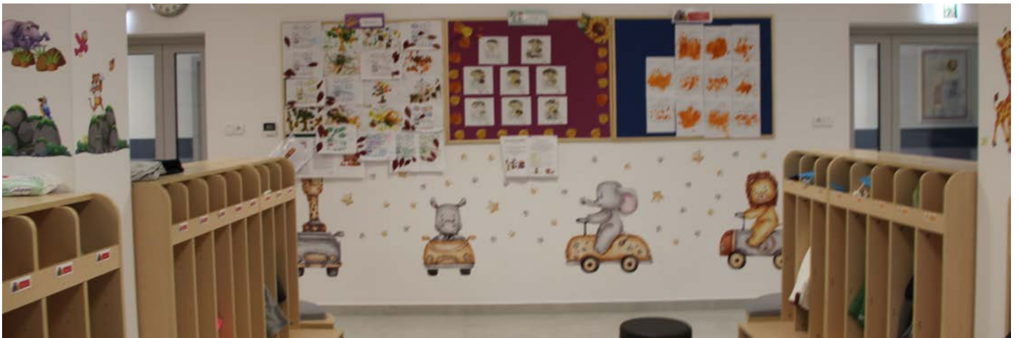
Szatnia pełna obrazów