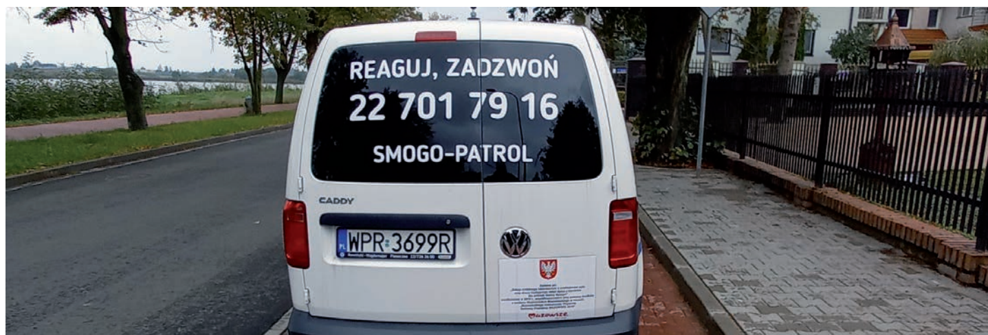
Raszyński Smogobus.

Wraz z początkiem sezonu grzewczego Gmina Raszyn rozpoczęła kontrole gospodarstw w zakresie użytkowania pieców grzewczych na paliwo stałe oraz stosowanych paliw. To już kolejna edycja tej akcji.