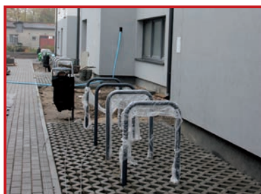
Przy chodnikach zamontowano stojaki na rowery.

Budowa jest obecnie w fazie końcowej; wykańczane jest wnętrze domu i otoczenie. Wokół budynku ułożono chodniki z betonowej kostki i postawiono latarnie. Wyznaczono teren zieleni, na którym powstał niewielki plac zabaw. Tuż przy wjeździe na posesję wybudowano spory śmietnik. Wewnątrz domu wykańczane są mieszkania. Odbywa się malowanie, montaż drzwi i kaloryferów. Glazurę położono w łazienkach i kąpielnicach kuchennych. Na klatkach schodowych zamontowano windy. Wiele rodzin czeka na przeprowadzkę.