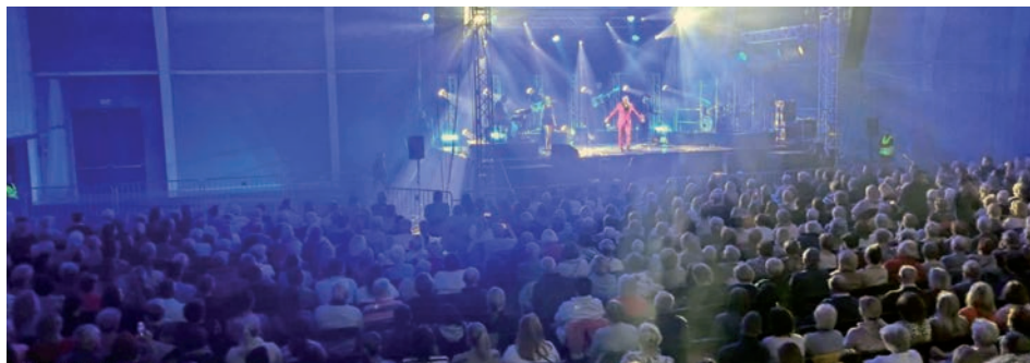
Publiczność wypełniła całą salę.