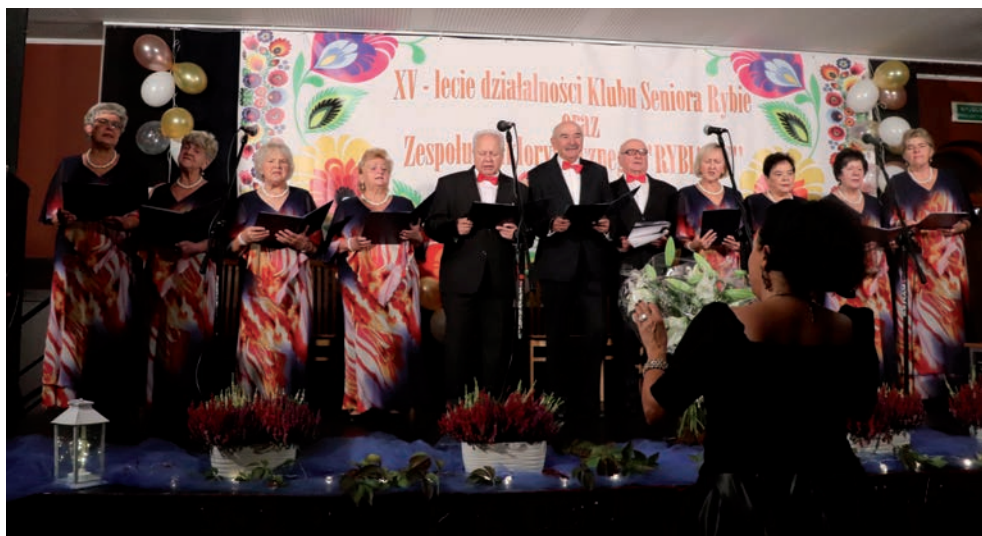
Zespół Folklorystyczny Rybianie.