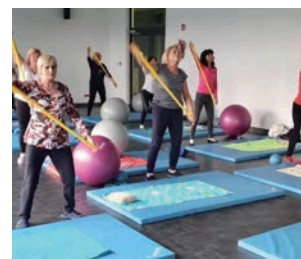
Zajęcia dla seniorów.