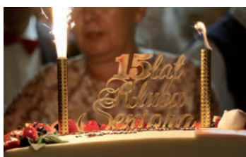
Tort dla Jubilatów.