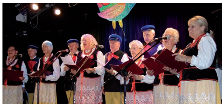
Barwy Jesieni.