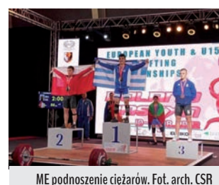
ME podnoszenie ciężarów.