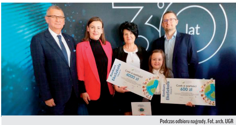
Podczas odbioru nagrody.