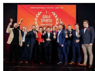
Gala sportu.