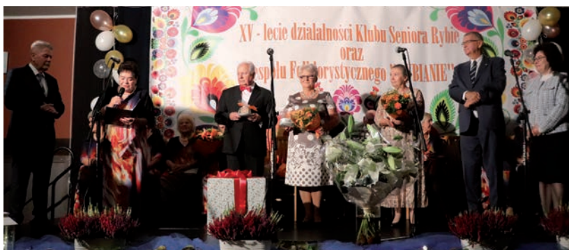
Gratulacje dla obecnego Zarządu Klubu.