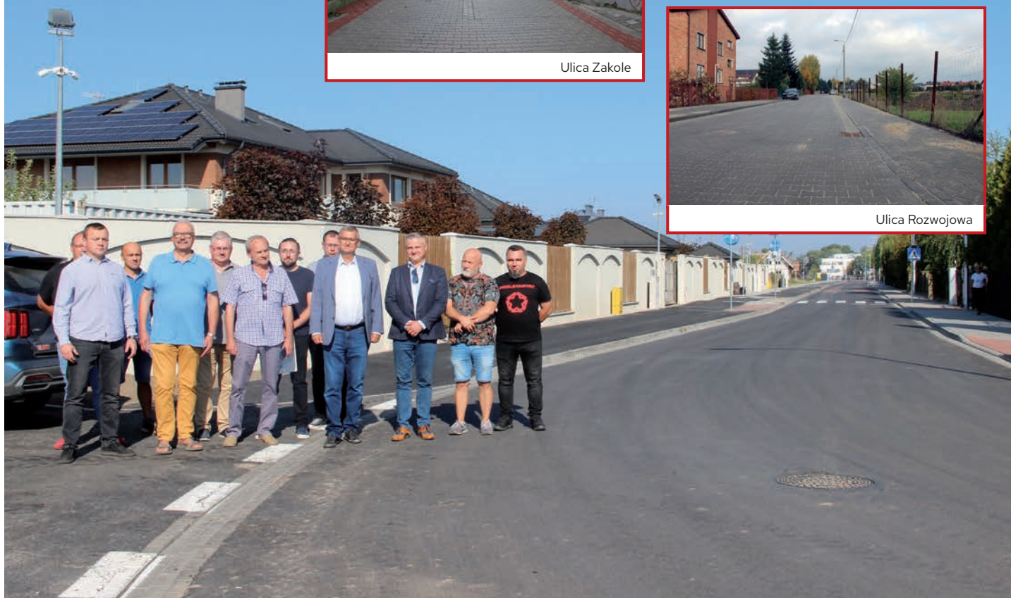
Odbiór ulicy Jana Miklaszewskiego