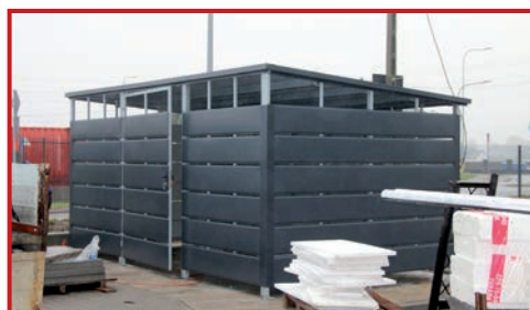
Postawiono śmietnik.