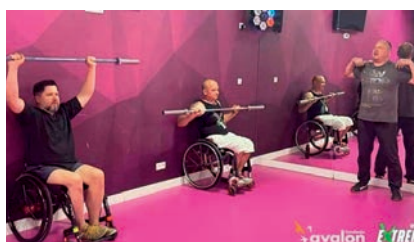
Trening Avalon.