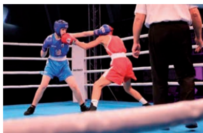
Gala Boksu KS Raszyn.