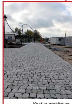
Kostka granitowa przed Austerią.