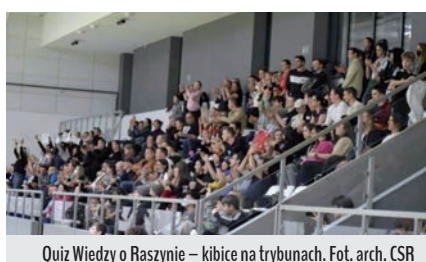
Quiz Wiedzy o Raszynie – kibice na trybunach.