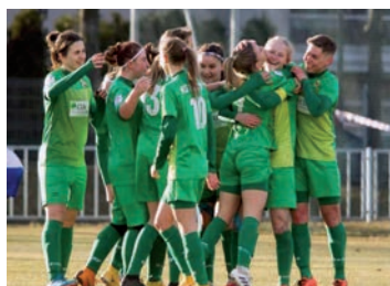
Mecz piłkarski KS Raszyn.