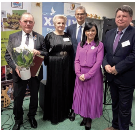
Goście honorarii i organizatorzy.