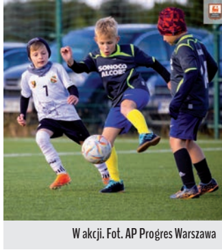
W akcji.