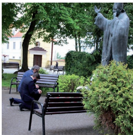
Kwiaty od samorządu.

18 maja 2020 r. obchodziliśmy 100 rocznicę urodzin Św. Jana Pawła II – Papieża Polaka. Czas pandemii sprawił, że uczciliśmy Wielkiego Polaka wiązkami kwiatów składanymi przed jego