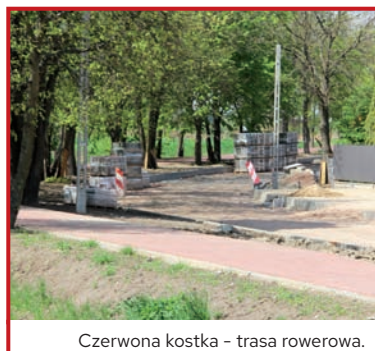
Czerwona kostka - trasa rowerowa.

Przebudowa drugiej części ulicy Zacisze na finiszu. Ścieżka rowerowa biegnąca nad wodą została połączona z fragmentem wybudowanym wcześniej i teraz prezentuje się okazale w całej zaprojektowanej długości od ulicy Waryńskiego do Godebskiego. Po przeciwnej stronie powstał chodnik, miejsce na przystanek autobusowy i parkingi. Instalacje kanalizacji deszczowej i sanitarnej wybudowane. Jeszcze tylko trzeba położyć nawierzchnię i wykonać odbiory techniczne. Tylko patrzeć gdy Nowe Grocholice zostaną dodatkowo połączone z Raszynem bardzo piękną ulicą, którą w przyszłości pojedzie autobus. Działania inwestycyjne gminy w tym miejscu są wynikiem trwającego od lat nacisku lokalnych społeczników; radnych – E. Surmacz, A. Matrackiej, K. Będkowskiego oraz sołtysów – A. Szelağa i B. Rusnak