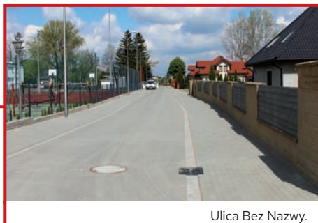
Ulica Bez Nazwy.

Obie ulice wykonano znacznie wcześniej niż gwarantował to termin przyjęty w umowie. W ulice wbudowano kanalizację sanitarną i deszczową, latarnie uliczne i zasilającą je linię energetyczną. W okolicy szkoły wybudowano spowalniacz dla samochodów. Nawierzchnię pokryto betonową szarą kostką, a ścieżkę rowerową kostką czarną. Wymalowano pasy na przejściach dla pieszych, oznaczono ścieżkę rowerową. Nie ma wątpliwości, gminie Raszyn przybyły nowe piękne ulice.