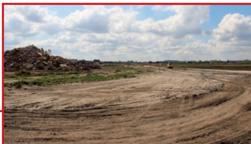
Najpierw przygotowano drogę serwisową.

Jak co miesiąc sprawdzamy stan zaawansowania budowy S7 – trzeciej drogi szybkiego ruchu przebiegającej przez naszą gminę. Na trasie przebiegu trasy S7 wyburzane są kolejne gospodarstwa przy ulicy Baletowej. Gruz z nich zwożony jest na hałdy i wkrótce po rozdrobnieniu będzie stanowił podkład pod jezdnie. Powstają tu też drogi serwisowe wzdłuż projektowanego ciągu trasy, które zanim zostaną włączone w system dróg lokalnych posłużą do przewozu materiałów budowlanych i maszyn koniecznych przy budowie środkowych jezdni. Kępy zieleni ochroniono od strony budowy różowymi siatkami i dzięki temu widać jak bardzo rozłożysta jest trasa S7.