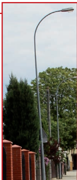
Nowe latarnie rozświetlą kolejne ulice.