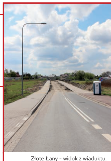
Złote Łany - widok z wiaduktu.