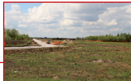
Zieleń jest zabezpieczona.