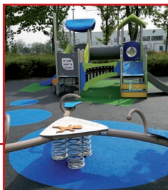
Nowy plac zabaw dla dzieci.