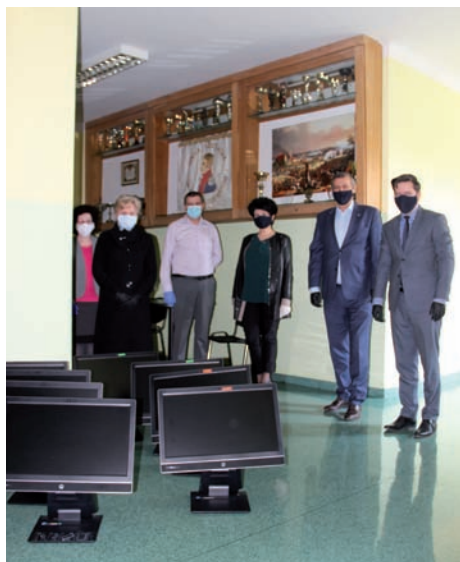
Takie komputery trafią do szkół.