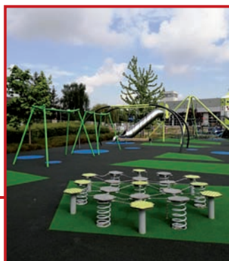
Plac zabaw za basenem.