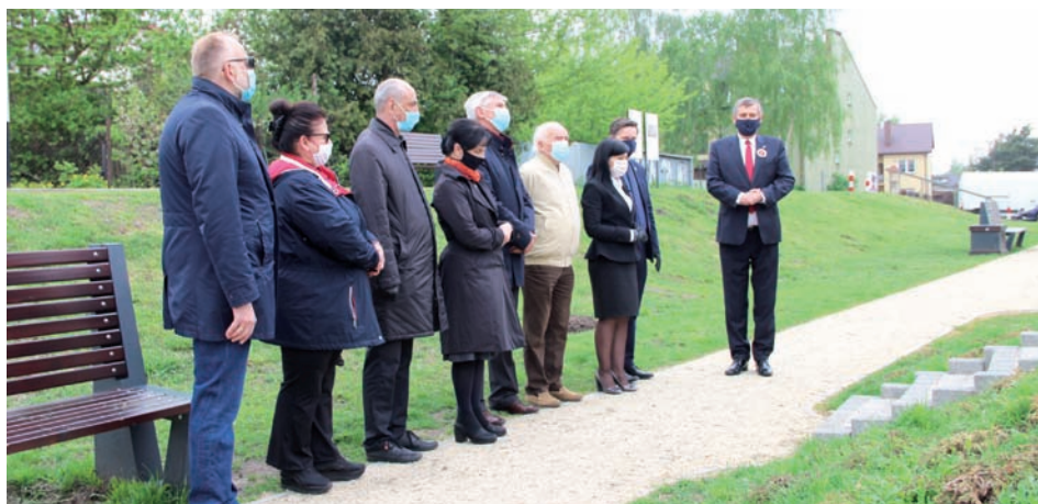
Przedstawiciele samorządu na Reducie Raszynskiej 3 maja.