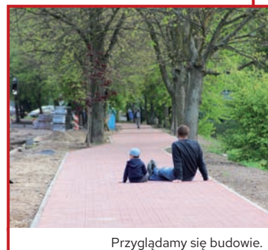
Przyglądamy się budowie.