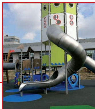
Wieża dla odważnych.