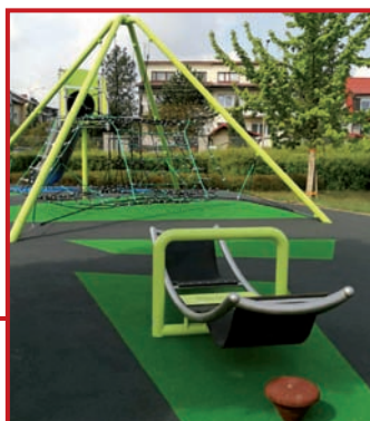
Huśtawka może też być taka.

Wartość całej inwestycji wyniosła ok miliona złotych, a dofinansowania zdobyte dzięki współpracy w ramach Lokalnej Grupy Działania Nadarzyn–Raszyn–Michałowice wyniosło 64% całej kwoty. Dofinansowanie pochodzi ze środków unijnych z poddziałania 19.2 w ramach strategii rozwoju lokalnego kierowanego przez społeczność, objętego Programem Rozwoju Obszarów Wiejskich PROW na lata 2014-2020.