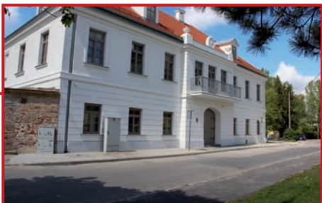
Front z nowym chodnikiem.

Austeria została odbudowana. Wokół budynku odbywają się drobne prace wykończeniowe i porządkowe. Wzdłuż elewacji frontowej od strony Alei Krakowskiej ułożono chodnik z granitowej kostki i wjazd do budynku. Z prawej strony frontu zbudowano podjazd na podwórze z takiego samego materiału. Podwórze uporządkowano zakładając trawniki obwiezione cisowym żywopłotem, ustawiając ławki i zapewniając miejsca do stacjonowania rowerów. Oczyszczone mury pozostałych zabudowań osłonięto siatką zamocowaną drewnianymi belkami. Wewnątrz zakończono fugowanie cegieł w suficie w piwnicach. Otwarcie austerii nastąpi po zluźnieniu przez rząd RP przepisów ograniczających imprezy z licznym udziałem publiczności.