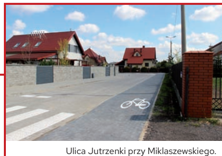
Ulica Jutrzenki przy Miklaszewskiego.