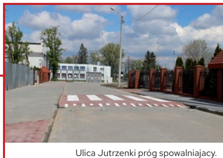
Ulica Jutrzenki próg spowalniający.