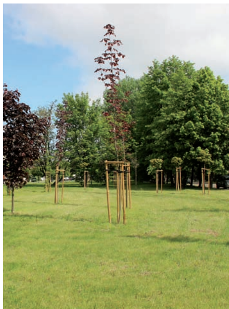
Skwer im. Rotmistrza Witolda Pileckiego.

Druga uchwała dotyczyła nadania nazwy Centrum Kultury Raszyn, położonego w Raszynie przy Al. Krakowskiej 29A, imię Jana Pawła II . W uzasadnieniu uchwały czytamy: „W dniu 18 maja 2020 r. świętujemy 100 – rocznicę urodzin Karola Wojtyły – późniejszego papieża Jana Pawła II. Jego rola