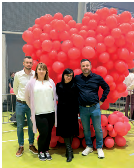
Ekipa Centrum Sportu Raszyn.

przekazali cegiełkę dla Wielkiej Orkiestry Świątecznej Pomocy. Społeczność Wietnamska zebrała 11 800 złotych i przesłała na konto WOŚP.