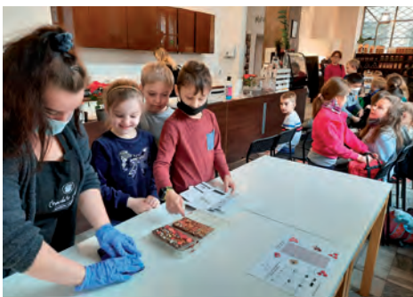
W Manufakturze Czekolady.

Każdy mógł pogłaskać konie, krowę czy króliki. W czasie podchodów pt. „Karnawałowe szaleństwo” dzieci poznały historię karnawału i uczyły się rozpoznawania polskich tańców narodowych. Podczas zajęć manualnych wykonały ozdoby walentynkowe. Niespodzianką był wyjazd do Manufaktury Czekolady w Warszawie, gdzie uczniowie nie tylko dowiedzieli się, jak powstaje czekolada, ale mogli samodzielnie ją wykonać, a potem delektować się jej smakiem. W Cinema City w Jankach obejrzały film „Skarb Mikołajka” i „O czym dzisiaj