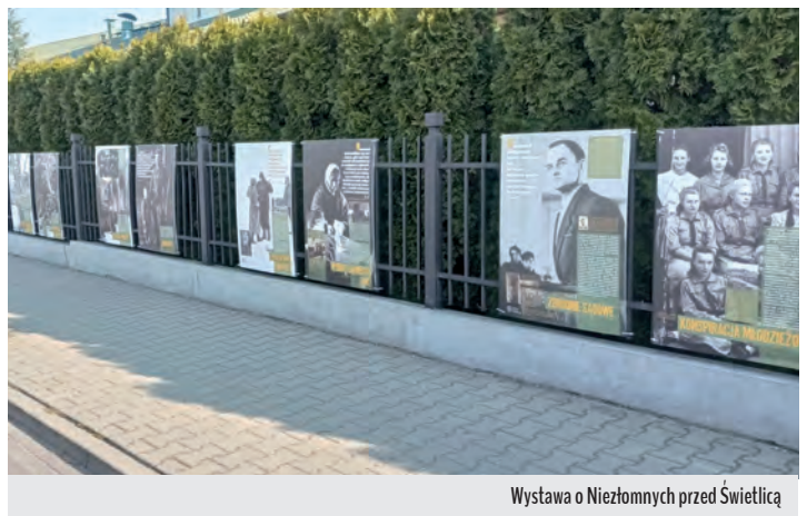
Wystawa o Niezłomnych przed Świetlicą