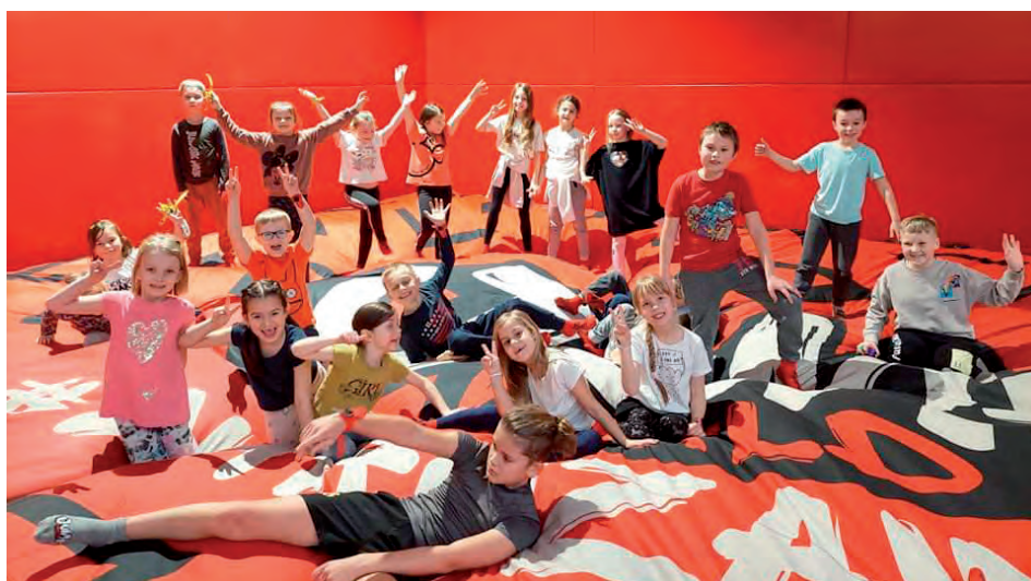
Jump World Trampolin

gle. Odwiedziliśmy także nasz Raszyński basen a dodatkową atrakcją były dmuchańce. Dzieci bardzo atrakcyjnie i pożytecznie spędziły wolny czas, miały zapewnioną fachową opiekę, a przede wszystkim świetną rozrywkę.