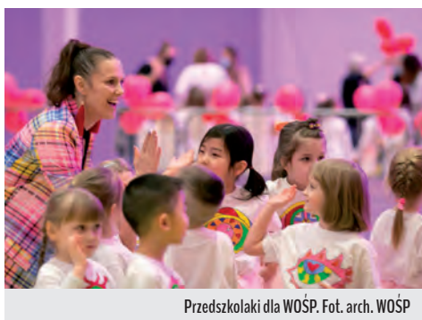
Przedszkolaki dla WOŚP.