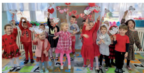
Poczta Walentynkowa.

W dniach 07–10.02.2022 r. w Przedszkolu w Sękocinie uruchomiono Poczta