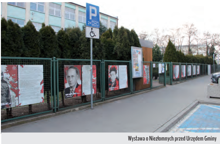
Wystawa o Niezłomnych przed Urzędem Gminy

Wystawy przygotowane przez IPN, opowiadające historie żołnierzy wyklętych, stworzone przez Biuro Edukacji Narodowej, można zobaczyć na parkanie przed Świetlicą Środowiskową Świetlik w Rybiu, ul. Spokojna 23, przed Urzędem Gminy Raszyn ul. Szkolna 2 oraz w Austerii. ZAPRASZAMY!