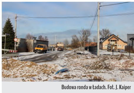
Budowa ronda w Ładach.

Koszt inwestycji: 3 199 353,00 zł. środkami własnymi gminy Raszyn: 734 123 zł. Jesienią 2021 roku Powiat Pruszkowski rozpoczął długo wyczekiwany przebudowę skrzyżowania ulicy Długiej z Drogą Hrabską, aż do mostku przy ulicy Za Olszyną. Inwestycję poprzedził wykup fragmentów działek graniczących z nią. Konieczne też okazało się przeniesienie kapliczki stojącej na rozwidleniu dróg. W efekcie ma powstać bezpieczne rondo z chodnikami – odwodnione i skanalizowane. Nowe rondo wraz z całą infrastrukturą około-