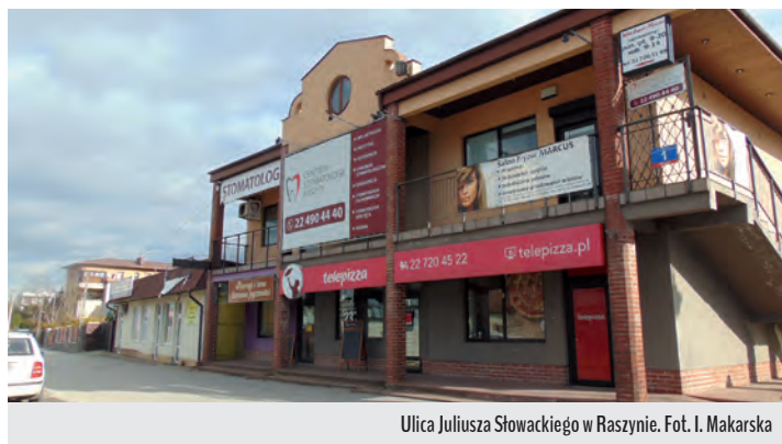
Ulica Juliusza Słowackiego w Raszynie.