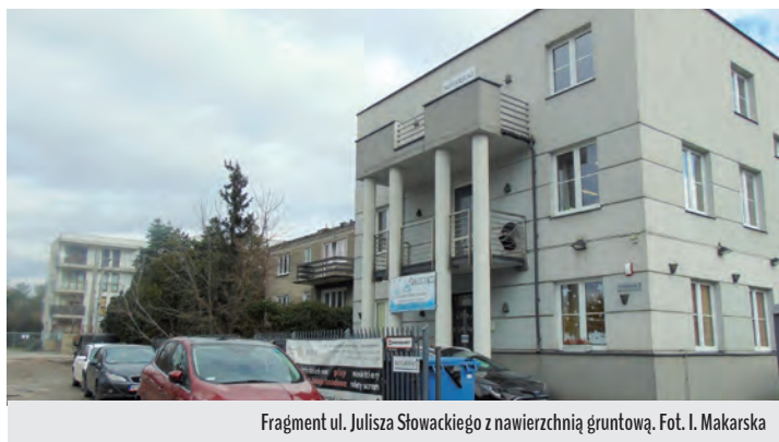
Fragment ul. Juliusza Słowackiego z nawierzchnią gruntową.

Maria Izabela Makarska Sołtys Sołectwa Raszyn II