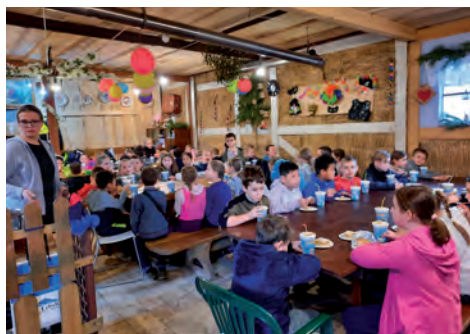
Poczęstunek w ośrodku NATURA WZYWA.

Podobnie jak w ubiegłych latach dzieci uczestniczyły w wielu ciekawych imprezach oraz wyjazdach. Niezapomniane wrażenie wywarł na nich pobyt w ośrodku „Natura Wzywa”, gdzie miały możliwość bliskiego kontaktu z przyrodą i zwierzętami gospodarskimi.