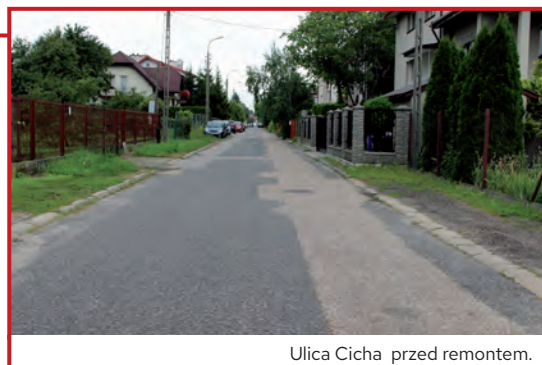
Ulica Cicha przed remontem.

Przebudowa nawierzchni ulicy Cichej o długości ok. 579,5 m, obejmuje swoim zakresem odtworzenie nawierzchni jezdni z betonu asfaltowego, wykonanie opasek i chodników oraz zjazdów indywidualnych z kostki betonowej, wykonanie elementów bezpieczeństwa ruchu, wykonanie oznakowania poziomego i pionowego. Do zakresu zamówienia, należy również: przebudowa kanalizacji deszczowej, budowa przyłączy wodociągowej i kanalizacyjnych w zakresie pasa drogowego i budowa kanału technologicznego. Wykonania wyżej opisanej przebudowy podjęła się firma ROKOM Sp. z o.o. z Warszawy za 1 954 470 PLN w 5 miesięcy od czasu podpisania umowy. Wykonawca już został wprowadzony na plac budowy. Przebudowa ulicy została w całości sfinansowana z budżetu gminy Raszyn.