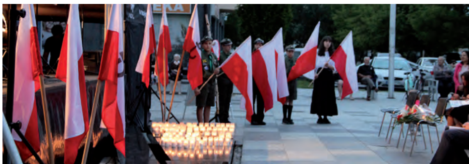
Biało czerwona scenografia

Samorząd gminy Raszyn i niezależna grupa kibiców Legii oddali cześć powstańcom warszawskim w siedemdziesiątą siódmą rocznicę wybuchu Powstania.