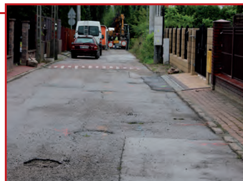
Prace w ulicy Łąkowej.

Przebudowa nawierzchni ulicy Łąkowej, obejmuje swoim zakresem odtworzenie nawierzchni jezdni z kostki betonowej, opasek i chodników oraz zjazdów indywidualnych, wykonanie elementów bezpieczeństwa ruchu, wykonanie oznakowania poziomego i pionowego. Do zakresu przedmiotu zamówienia, należy również budowa kanalizacji deszczowej, budowa sieci wodociągowej oraz kanalizacyjnej wraz z wykonaniem przyłączy a także wykonanie robót tymczasowych i prac im towarzyszących. Inwestycję poprowadzi firma Delta S.A. z Warszawy za 2 198 480 zł.