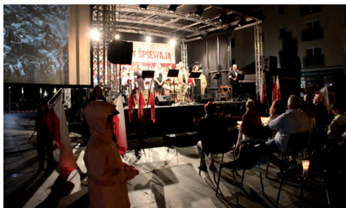
Koncert Raszyniacy śpiewają pieśni.