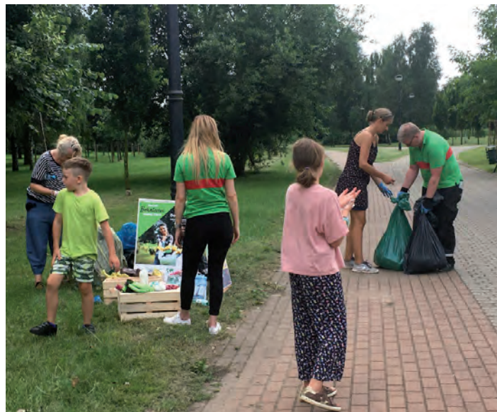
Czysty Raszyn.

dionową. Akcja miała charakter edukacyjny, ponieważ uczestnicy zyskali wiedzę na temat segregacji odpadów i działań pozwalających ograniczyć śmiecenie. Podczas wydarzenia panowała dobra atmosfera. Uczestnicy akcji „Czysty Raszyn” otrzymali od Centrum Kultury Raszyn upominki, zaś Leroy Merlin częstowało batonikami i wodą.