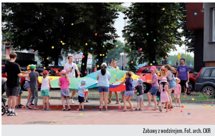
Zabawy z wodzirejem.