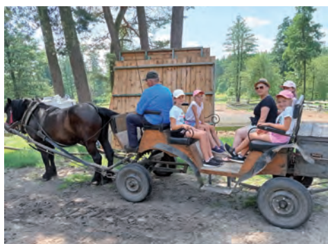
W Stajni Kaliskiej.