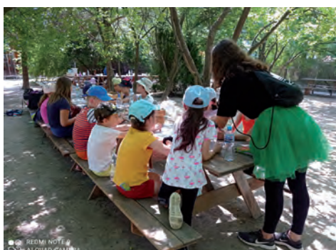
Budujemy leśne domki w Sadach Klemensa.