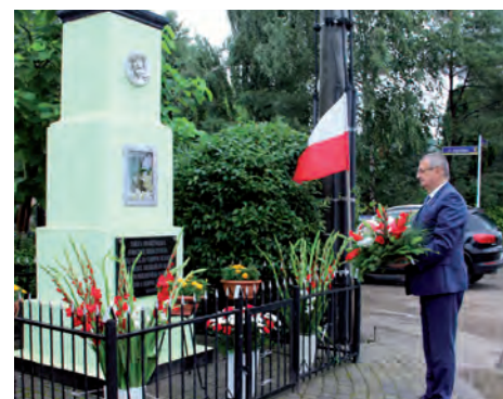
Kwiaty od Gminy pod kapliczką