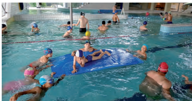
Wakacyjne pływanie.