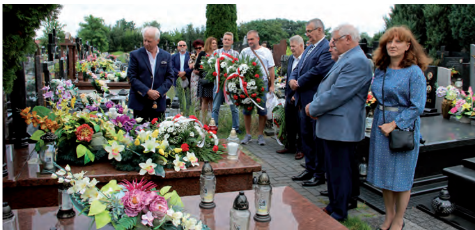
Kwiaty, znicze i czas zadumy.

Wydarzenie – legenda – mit, tak się zapamiętuje historię.