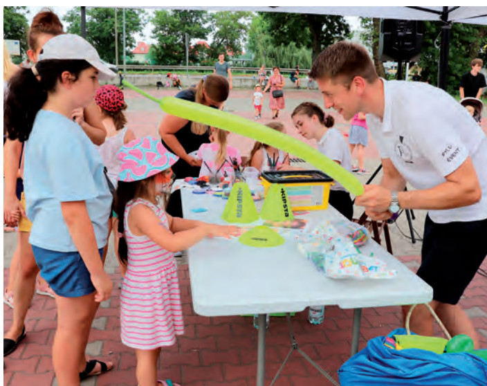
Malowanie buziek i balony – nieodłączna atrakcja.

Ogromnym zainteresowaniem wśród dzieci i rodziców cieszą się teatrzyki. Centrum Kultury Raszyn odpowiada na te potrzeby i organizuje kolejne spektakle. 4 lipca dzieci mogły zobaczyć teatrzyk „Dobre rady Lisa Witalisa” w wykonaniu artystów z teatru O! Teatr.