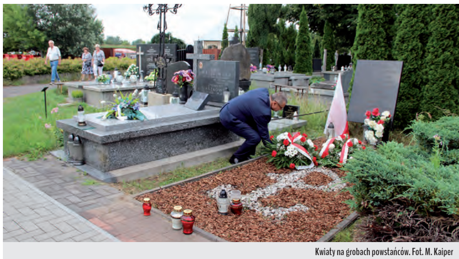
Kwiaty na grobach powstańców.