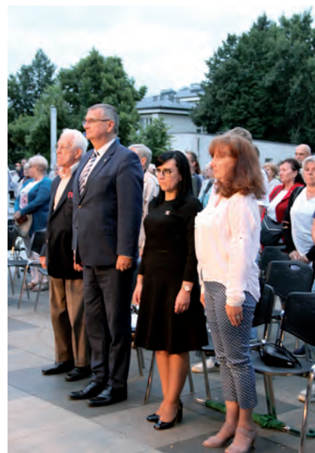
Modlitwa AK.