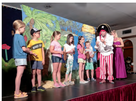
Tetrazyk w Świetliku.