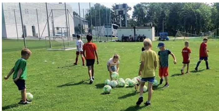
Wakacyjna piłka nożna.