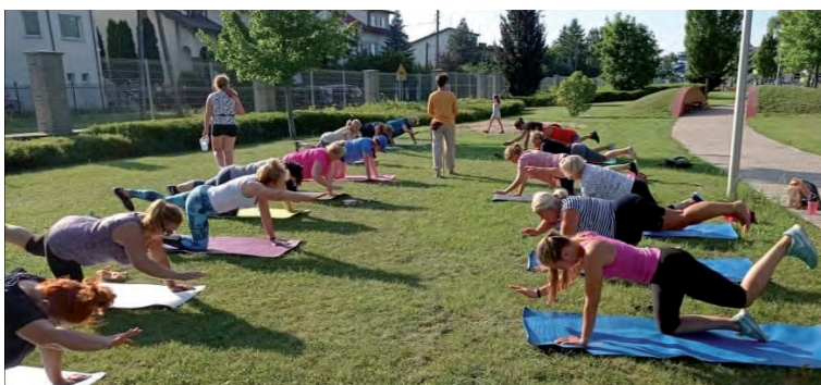
Zdrowa sylwetka w plenerze.