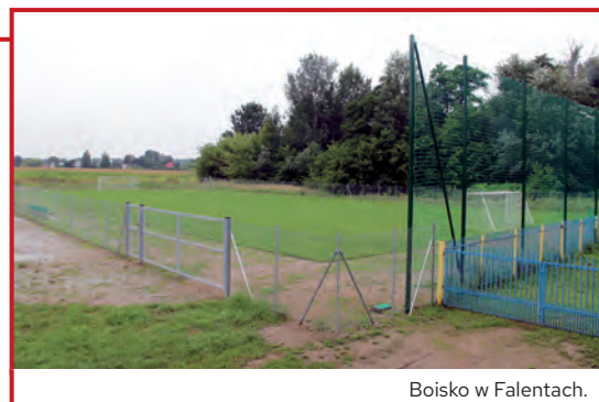
Boisko w Falentach.

Boisko trawiaste w Falentach budowane przez firmę KACPER Sport Invest Leszek Zdybel nabiera ostatecznego kształtu. Ukształtowana płyta główna o powierzchni 1800m 2 weszła w okres sezonowania nawierzchni, czyli po ludzku mówiąc ukorzeniania się trawy, co trwa przynajmniej trzy miesiące. Cały teren otacza estetyczne ogrodzenie. Piłkochwyty od strony placu zabaw zamocowane. Ławki dla sportowców i bramki też już są. Bieżnia wokół pokryta żwirem oczekuje na ostateczną nawierzchnię. Przypominamy całkowity koszt budowy boiska wyniesie 492 000 złotych.