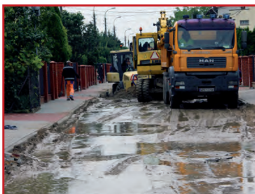
Ulica Olszowa od północy.