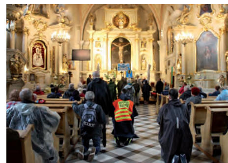
Powitanie w kościele