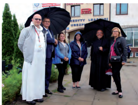
W oczekiwaniu na pielgrzymów

„Warszawska Pielgrzymka Piesza nazywana także paulińską, początkami sięga XVIII w. i jest najstarszą wyruszającą ze stolicy. W 1711 r. Bractwo Pana Jezusa Pięciorańskiego przy paulińskim kościele św. Ducha w Warszawie poprowadziło pielgrzymkę na Jasną Górę w imieniu miasta prosząc o ocalenie przed szalejącą epidemią. Do dziś w częstochowskim Sanktuarium przechowywana jest srebrna tablica – wotum mieszkańców Warszawy, złożone z prośbą o oddalenie zarazy.” KAI