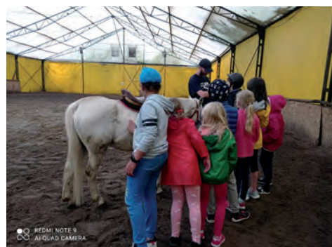
Kolejka do jazdy na kucyku.