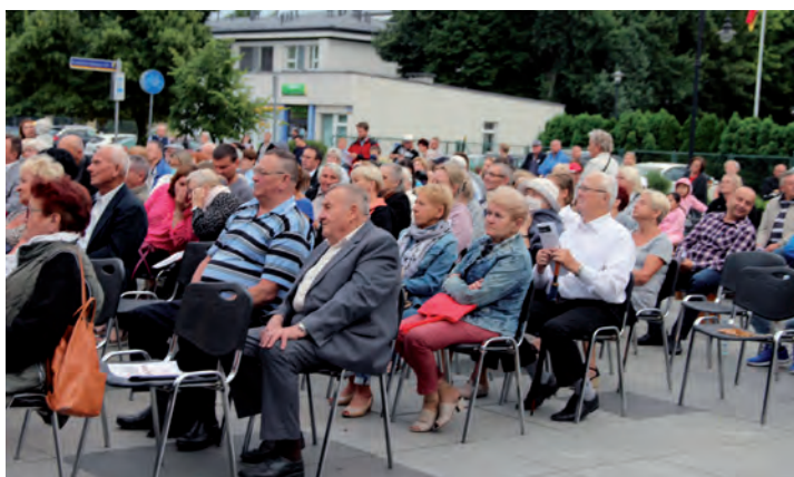
O 20.00 nie było miejsc siedzących.