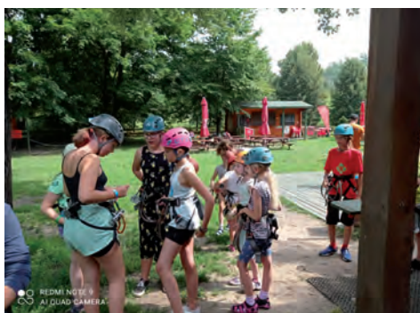
Przygotowania do wspinania.