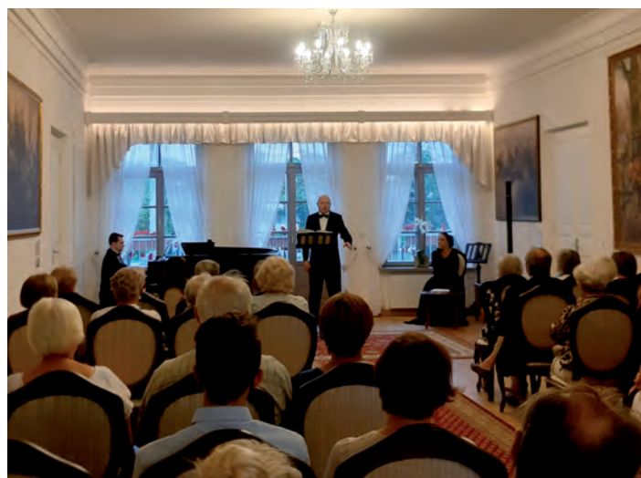
Koncert w Austerii.