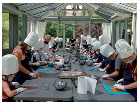
Warsztaty kulinarne w Wilanowie.