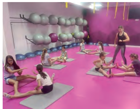
Fitness dla dzieci.

działek i środę są to zajęcia z jogi, natomiast we wtorek i czwartek odbywają się zajęcia rekreacyjno-ruchowe. Obie formy aktywności cieszą się dużym zainteresowaniem i mieszkańcy Gminy Raszyn chętnie z nich korzystają.