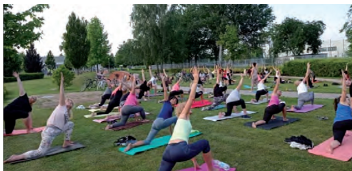
Joga w plenerze cieszyła się wielkim powodzeniem.