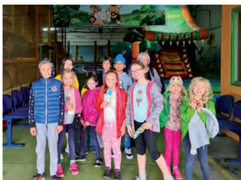
W Pepelandzie.