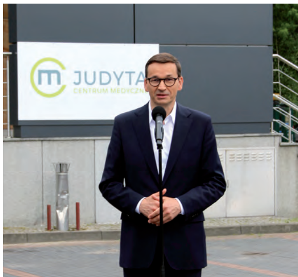
Premier Mateusz Morawiecki ogłasza Program Zdrowotny Profilaktyka40PLUS.