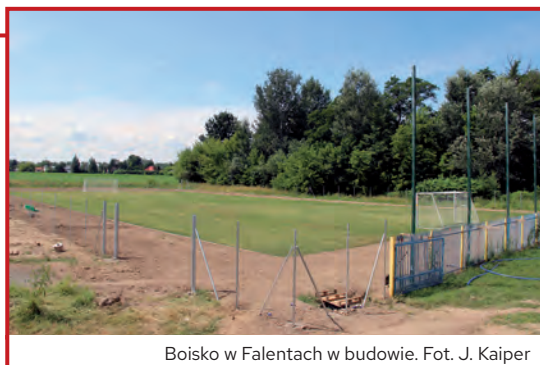
Boisko w Falentach w budowie.

Dobiega końca budowa ogólnodostępnego boiska do piłki nożnej w Falentach na terenie Gminy Raszyn prowadzona przez firmę KACPER Sport Invest Leszek Zdybel. Przedmiotem finalizowanej inwestycji jest budowa płyty o wymiarach 60 m x 30 m, o nawierzchni trawiastej z gotowej darni w rolkach. Obejmuje ona wykonanie ogrodzenia, piłkochwyłów oraz elementów małej architektury w postaci ławek dla zawodników i koszy na śmieci wraz z przebudową sieci wodociągowej zlokalizowanej pod płytą. Podstawowe parametry boiska: całkowita powierzchnia – 1 800 m 2 ; bramki o wymiarach – 500 cm x 200 cm, ogrodzenie z siatki stalowej z furtką i bramą o łącznej długości ok. 190 m, piłkochwyły wysokości 6 m i długości 37 m. Całkowity koszt wyniesie 492 000 złotych.