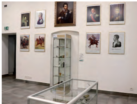
Wnętrze Austerii.