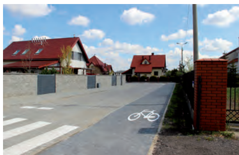
Ulica Jutrzenki przy Miklaszewskiego