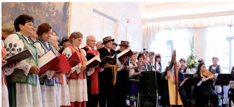
Raszyńskie Zespoły Śpiewacze podczas inauguracji.