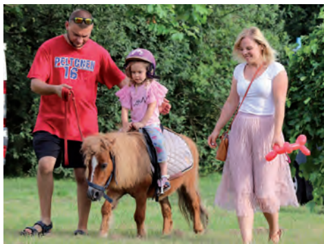
A mniejsi na kuczki.