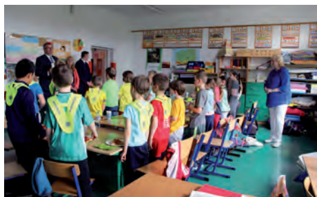
Gratulacje dla uczniów SP z Raszyna

przy frekwencji 96,9% Każda z klas uczestniczących w kampanii otrzymała upominki ufundowane przez Wójta Gminy Raszyn.