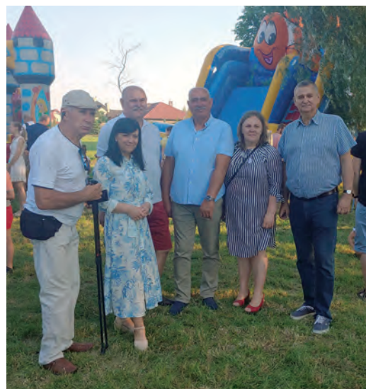
Z archiwum KGW SQŁAD

Dzień 19.06.2021 r zapisał się w historii wsi Łady jako jeden z bardziej udanych, bowiem nad pięknym, dużym stawem przy ul. Za Olszyną odbyła się plenerowa impreza o wdzięcznej nazwie „Wianki”. Organizacją zajęło się sołectwo Łady oraz prężnie działające KGW SQŁAD. Przygotowania trwały od samego rana, po to aby wszystkie zaplanowane atrakcje dosłownie „wypaliły” na sto procent. Z polnych kwiatów zrywanych już od świtu, można było zapleść fantazyjne wianki na głowę, które po zachodzie słońca zostały puszczane do stawu. Po szaleństwach na dmuchańcach dzieci mogły ochłodzić się pysznymi lodami, a rodzice orzeźwiająco lemo-