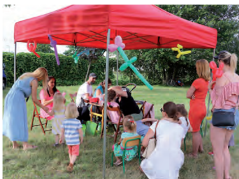
Malowanie buziek – stały hit.