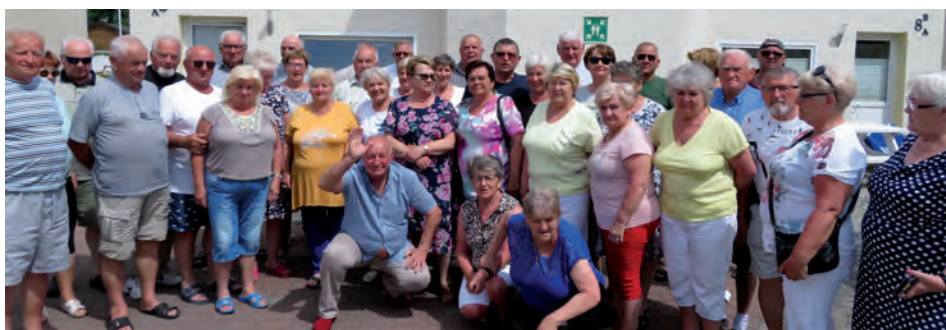
Na wycieczce.