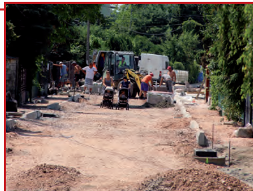
Ulica Orzechowa skrzyżowanie z ulicą Olszową.