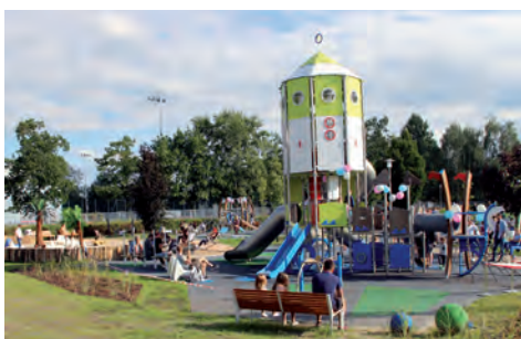
Plac zabaw przy basenie