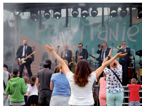
Poparzeni Kawą Trzy budzili entuzjazm.