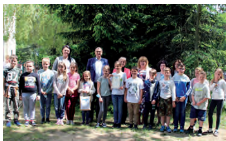
Gratulacje dla uczniów SP z Sękocina