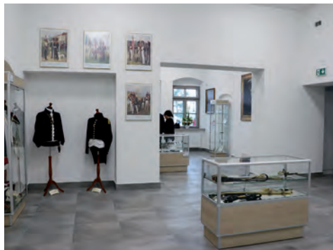
Wnętrze Austerii.

4 lipca drzwi Austerii dla wszystkich były otwarte od godziny 8.00. Mieszkańcy ponownie licznie odwiedzili Wizytówkę