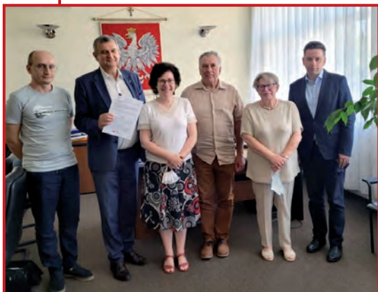
Dobry zespół to dobra robota.