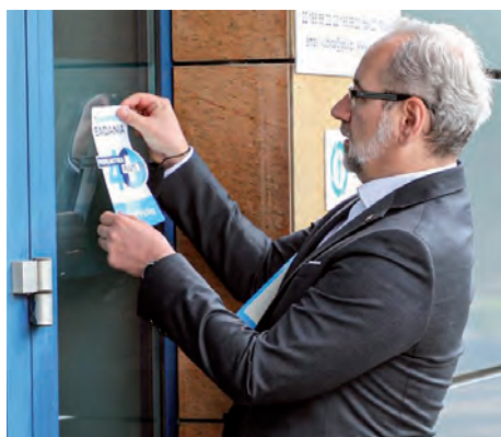
Inauguracja Profilaktyka40PLUS w Judycie.