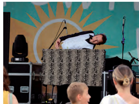
Ale numer.