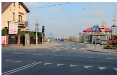
Ulica Złote Łany