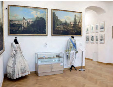
Wnętrze Austerii.