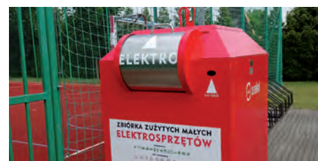
Kontener na terenie Świetlika.