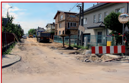
Ul. Olszowa od ul. Wesołej w budowie