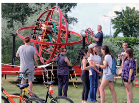
Atrakcja dla najodważniejszych.