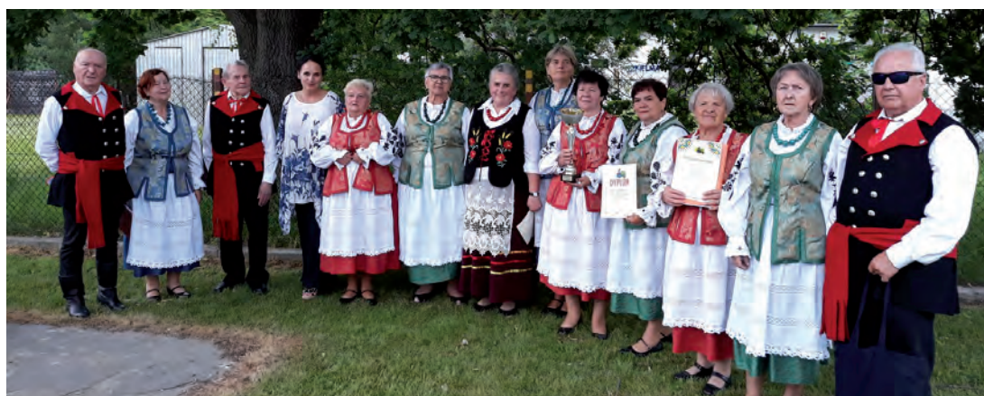
Rybianie uhonorowani dyplomami.