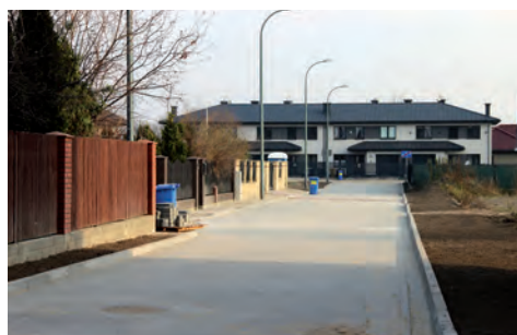
Ulica Hetmańska w stronę Rycerskiej