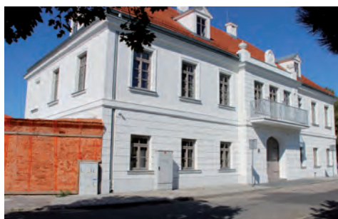
Austeria – elewacja frontu.