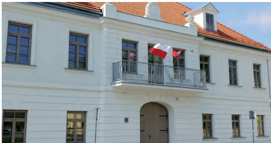
Austeria – wizytówka Raszyna.

WYJĄTKOWY DZIEŃ DLA MIESZKAŃCÓW GMINY RASZYN. 3 LIPCA ODBYŁO SIĘ UROCZYSTE OTWARCIE AUSTERII, Z KOLEI 4 LIPCA DZIEŃ OTWARTY Z ATRAKCJAMI.