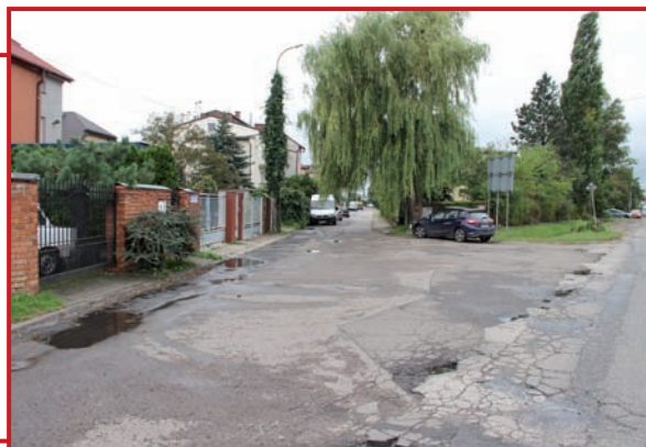
Ulica Orzechowa do przebudowy.

Urząd Gminy Raszyn opublikował zamówienie na przebudowę ulicy Orzechowej w miejscowości Rybie na terenie gminy. W skład zadania wchodzi wykonanie nowej nawierzchni bitumicznej długości ok. 415 m – nowej nawierzchni z betonowej kostki betonowej – ok. 1150 m 2 . – sieci kanalizacji deszczowej o dł. ok. 190 m z rur PVC 42 m, budowa 12 szt. studni 1 200 mm, budowa 15 szt. studni 500 mm, sieci wodociągowej 140 m.