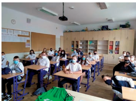
Klasa 7c – zamaskowana.

1 września 2020 roku – to rozpoczęcie inne, niż zwykle. Inne, wcale nie oznacza gorsze, ale trudniejsze. Najważniejsze zadanie to pracować i uczyć się w bezpiecznych warunkach. Zorganizowanie pracy szkoły w okresie pandemii zgodnie z wytycznymi MEN i Sanepidu, opracowanie