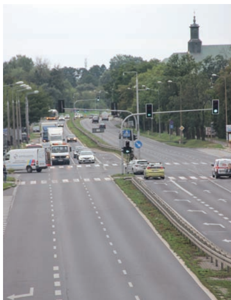
Al Krakowska nie jest pusta.

– Na drugą składają się propozycje wykraczające poza możliwości prawne i finansowe gminy. Należy pamiętać, że gmina nie ma prawa inwestować na cudzym gruncie, dlatego w pierwszym rządzie musiała odrzucić wszystkie te propozycje, które terytorialnie wychodziły poza własność gminy, np. budowa rond, czy przykrycie rowów przydrożnych. Gmina budowała chodniki wzdłuż dróg powiatowych poprzez