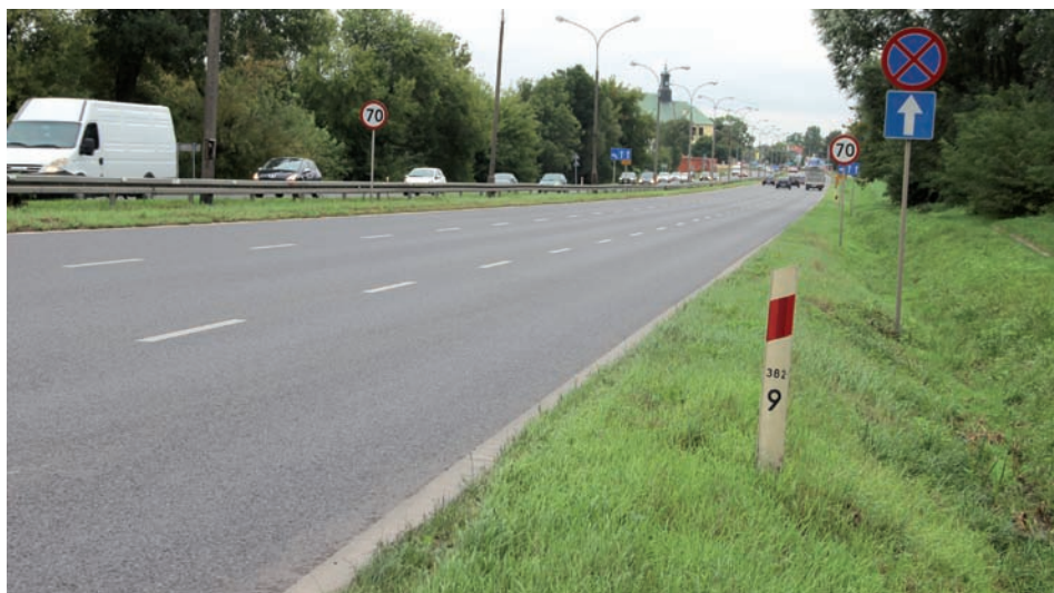
Aleja Krakowska – gminna droga szybkiego ruchu.

dofinansowanie powiatu w tym celu. Natomiast przebudowa jezdni i wyposażenie Alei Krakowskiej w kanalizację burzową przy jednoczesnym obciążeniu kosztem utrzymania blisko ośmiokilometrowej ulicy o szerokości 50 m znacznie przekracza możliwości budżetu gminy, nawet jeśli wykonanie tych inwestycji zostanie rozłożone na lata.