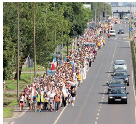
306 Pielgrzymka przed epidemią.

jeden pątnikom towarzyszyło duchowo tysiące pozostałych w domach, łącząc się z nimi w intencji i modlitwie.