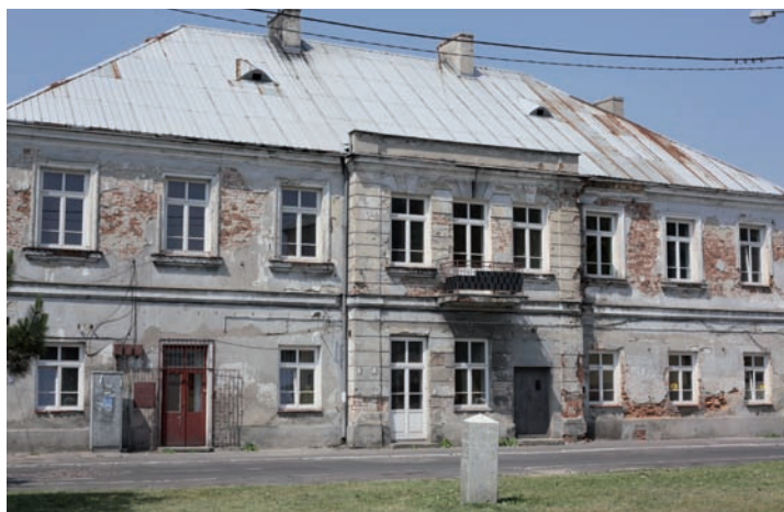
2011 r. Austeria – elewacja od frontu.