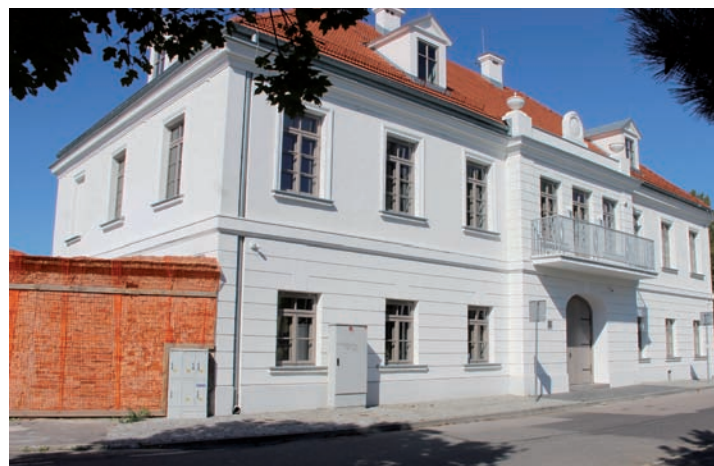
2020 r. Austeria – elewacja frontu.

swą historię właśnie od austerii i jej zabudowań.