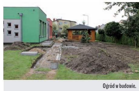
Ogród w budowie.

Ścieżka mineralno-żywiczną sfinansowana jest w całości z funduszy europejskich, które zostały pozyskane przez gminę Raszyn, w ramach programu „Przedszkolna Integracja w Raszynie”. Wartość całkowita projektu to kwota 343 220,00 zł, dofinansowanie 274 576,00 zł. Środki te są przeznaczone nie tylko na budowę ogrodu