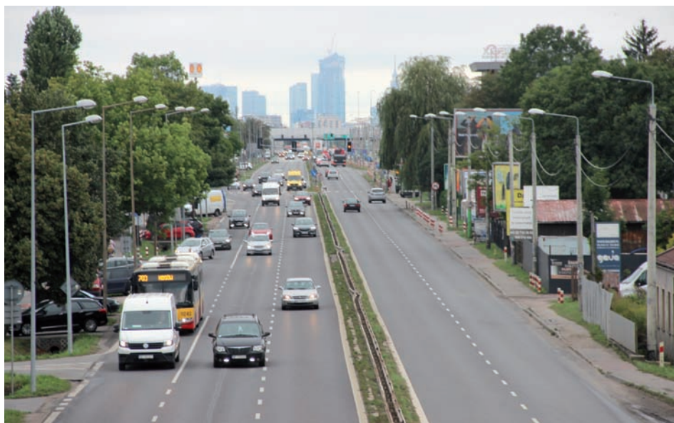
Aleja Krakowska „droga gminna”.