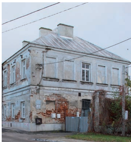
2017 r. Austeria – elewacja od ul. Godebskiego.