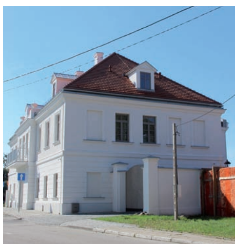
2020 r. Austeria – elewacja od ul. Godebskiego.

wiedziały o historycznej i architektonicznej wartości zespołu austerii. Wielokrotnie przymierzały się do przywrócenia obiektom dawnej świetności. Bezskutecznie.