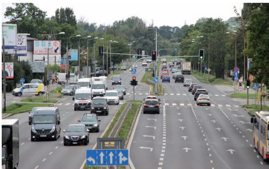
Najlepiej fotografować z góry.