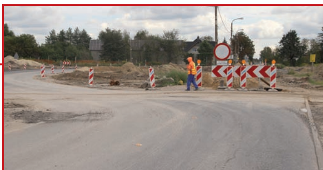
Objazd fragmentu Baletowej.