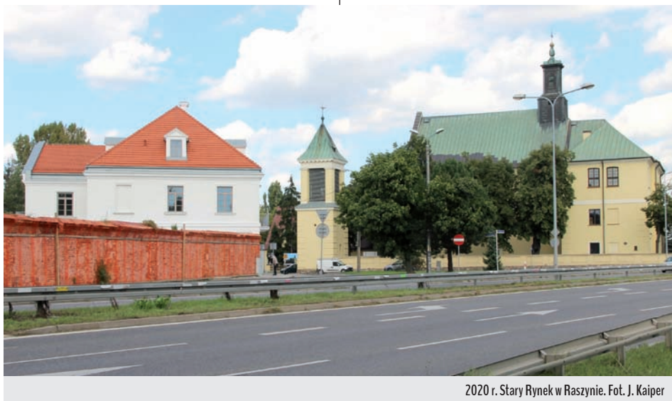
2020 r. Stary Rynek w Raszynie.

Więcej informacji o budynkach wchodzących w skład zespołu austerii pojawia się przy okazji opisywania działalności lokalnych instytucji, które w nim się mieściły. I właśnie one dowodzą, że każda ważna organizacja, która powstawała na terenie majątku Falenty, czy we wsi Raszyn, zaczynała