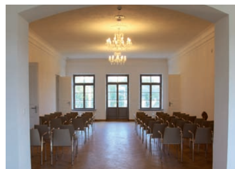
2020 r. Holl na piętrze.