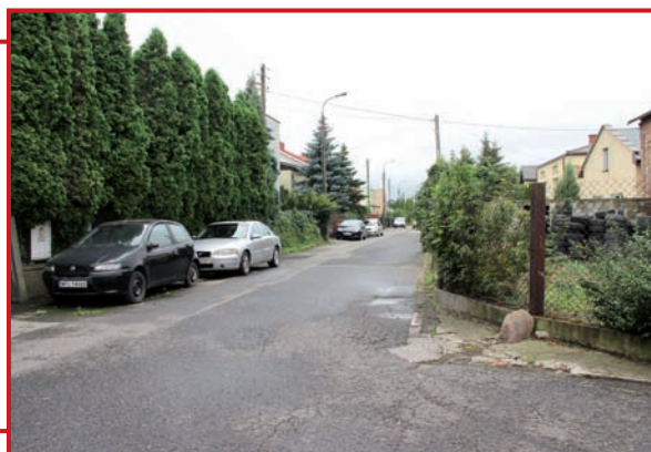
Przebudowa ulicy Akacjowej.

Urząd Gminy Raszyn opublikował zamówienie na przebudowę ulicy Akacjowej w miejscowości Rybie. W jej ramach wykonana zostanie nawierzchnia z kostki betonowej ok. 310 m, ustawione zostaną krawężniki i obrzeża razem 780 m, wybudowana sieć kanalizacji deszczowej razem 360 m z rur PVC oraz studnie w ilości 33 szt. w zakres budowy wchodzi również sieć wodociągowa 25m oraz – przyłączy kanalizacji sanitarnej.