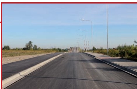
Złote Łany przed wiaduktem.