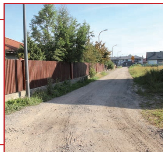
Ulica Hetmańska do budowy.