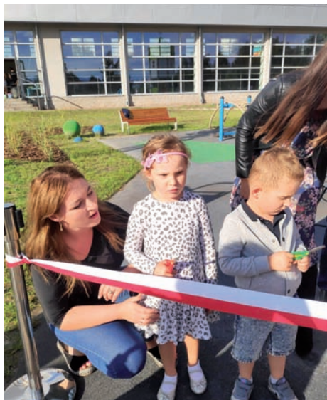
Tuż przed przecięciem.

Nowoczesny Plac Zabaw za Basenem powstał z dofinansowania ze środków PROW 2014-2020 udostępnionych