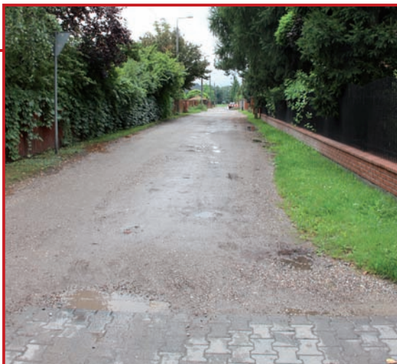
Ulica Lecha do przebudowy.