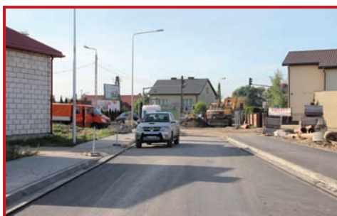
Skrzyżowanie – Złote Łany z Warszawską.

Na całym przebiegu warszawskiego odcinka trasy S7 trwają intensywne prace. Na granicy Dawid Bankowych i Warszawy powstaje wiadukt, dlatego fragment ulicy Baletowej wyłączono z ruchu i wybudowano objazd. Wiercone są otwory na fundamenty pod filary, a po obu stronach Baletowej zwożone jest kruszywo na formowany wiadukt. Po stronie Zgorzały najlepiej widać nowy szlak trasy, wyraźnie zaznaczają się granice jezdni otoczone teraz rowami odwadniającymi.