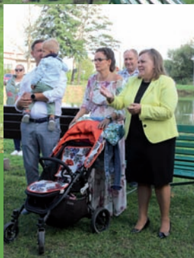
Uczestnicy i organizatorzy.