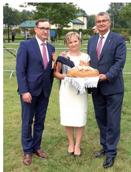
Gospodarze Dożynek 2020.

Zgodnie z ugruntowaną tradycją podzieliliśmy się chlebem wypieczonym z tegorocznych ziaren. Poczęstunek roznieśli pomiędzy mieszkańców Gospodarze Dożynek i Wójt Gminy Raszyn a następnie rozstrzygnięty został Konkurs na najwspanialszy wieńiec dożynkowy. Prawdę mówiąc, wszystkie były wyjątkowo urodziwe