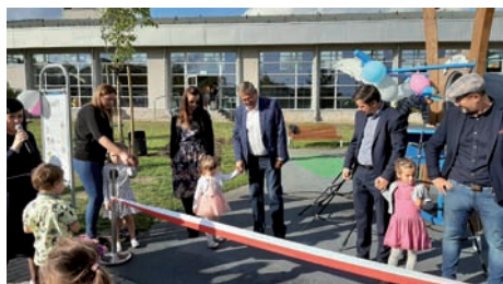
Przygotowanie przed otwarciem.

Park Jordanowski za basenem znajduje się w centralnym miejscu Gminy Raszyn. Wchodzi w skład Centrum Sportu Raszyn wraz z pływalnią, stadionem im. K. Jedynaka oraz nową halą sportową. Położony tuż obok parku tworzy swoisty kompleks sportowo-rekreacyjny przy Centrum Sportu Raszyn. Dzięki małej infrastrukturze parkowej tj. chodnikowi, ławkom, ścieżce rowerowej i siłowni zewnętrznej stał się miejscem integracji społecznej w szczególności młodych rodziców z małymi dziećmi.