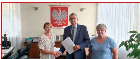
Umowa z firmą UNIBUDEX zawarta.