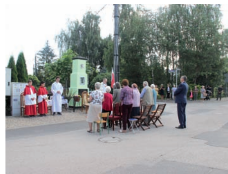
Msza polowa na ulicy 6. Sierpnia.