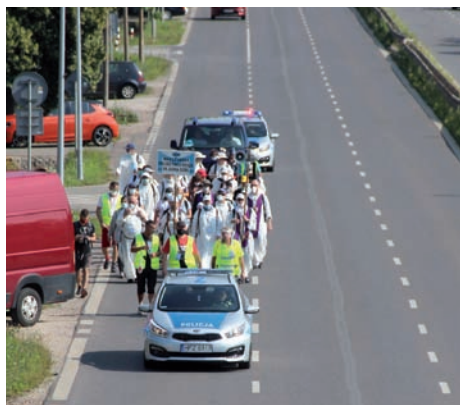
309 Pielgrzymka.

Warszawska Pielgrzymka Piesza nazywana także paulińską, początkami sięga XVIII w. i jest najstarszą wyruszającą ze stolicy. W 1711 r. Bractwo Pana Jezusa Pięciorańskiego przy paulińskim kościele św. Ducha w Warszawie poprowadziło pielgrzymkę na Jasną Górę w imieniu miasta prosząc