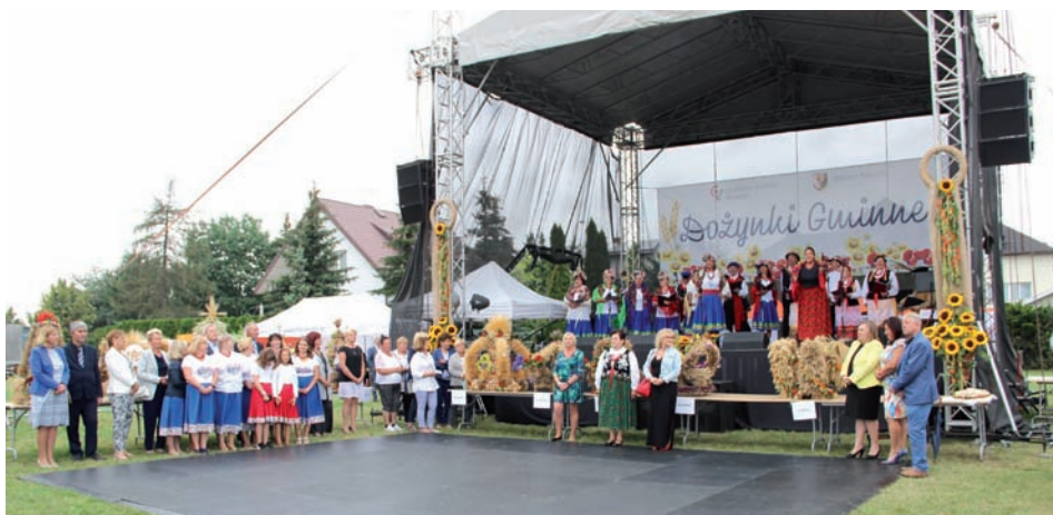
Dożynki w pełnej krasie.

Stało się już zwyczajem, że w Raszynie dożynki obchodzi się w parku. Dlatego organizatorzy ustawili w parku scenę, a przed nią parkiet, aby Dożynki 2020, mimo ostrożności ze względu na pandemię koronawirusa odbyły się zgodnie. Pomimo obaw dopisała i publiczność, i aura. 30 sierpnia impreza trafiła na dobrą pogodę i wszystkie zaplanowane uroczystości mogły się odbyć. Znacznie większy, niż ewentualna niepogoda wpływ na nasze Dożynki 2020 odcisnął COVID 19 ponieważ program był okrojony i sprowadzał się do Mszy i obrzędów dożynkowych zakończonych ogłoszeniem werdyktu, w konkursie o miano najpiękniejszego wieńca.