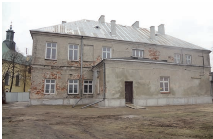
2014 r. Austeria – elewacja od podwórza.

PLANY RESTAURACJI AUSTERII Władze Gminy Falenty i Raszyn