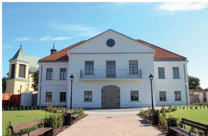
2020 r. Austeria – elewacja od podwórza.