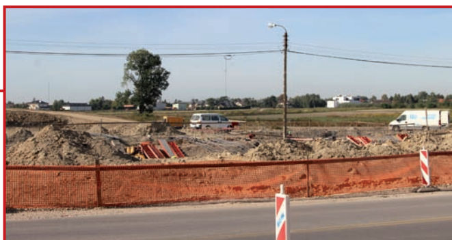
S7 zbrojenia wiaduktów.