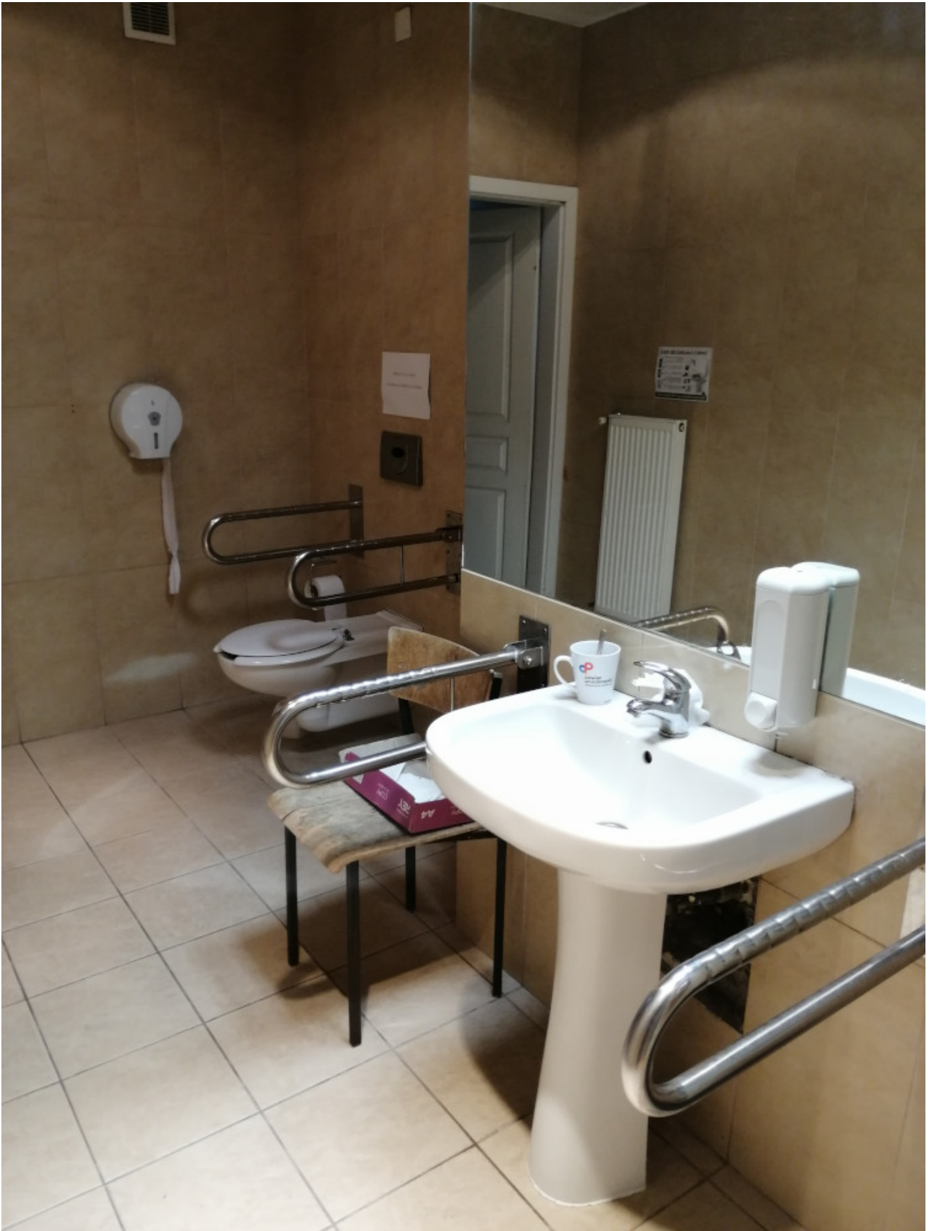
Jeden z referatów Urzędu Gminy Raszyn – Referat Funduszy Zewnętrznych - wraz z Gminnym Ośrodkiem Pomocy Społecznej i Gminnym Przedsiębiorstwem Komunalnym „Eko-Raszyn” znajduje się w innym budynku przy ul. Unii