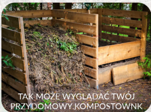
TAK MOŻE WYGLĄDAĆ TWÓJ PRZYDOMOWY KOMPOSTOWNIK